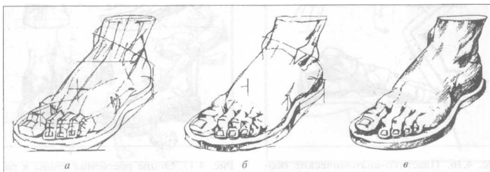
Рис. 4.14. Этапы рисования гипсового слепка стопы

Составьте последовательность рисования ступней ног с гипсового слепка, состоящую из 4 этапов. Опишите эти этапы.